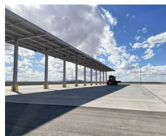
ISOタンクコンテナ置き場