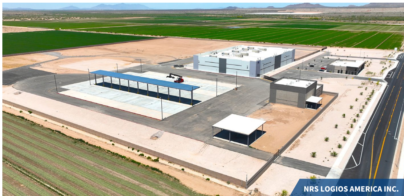
NRS LOGIOS AMERICA INC.

NRSは2025年5月、米国アリゾナ州における新たな総合物流拠点として、「 NRS LOGIOS AMERICA INC. 」を開業いたしました。半導体やバッテリー原材料を中心に化学品物流の旺盛な需要に対応するとともに、さまざまな物流機能をワンストップで提供し、お客様のサプライチェーン最適化を追求。「NRS OCEAN LOGISTICS LTD.」、「NRS LOGISTICS AMERICA INC.」と連携し、最適かつ高品質な物流サービスをご提供します。